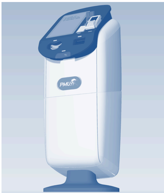
Pari réussi en 2025 pour la nouvelle borne PMU

· Dans les domaines des transports et du bâtiment, en concevant des éléments de mobilier et d'accessoires intégrés, répondant aux contraintes de sécurité, de modularité et de résistance, tout en conservant une identité visuelle claire et durable.