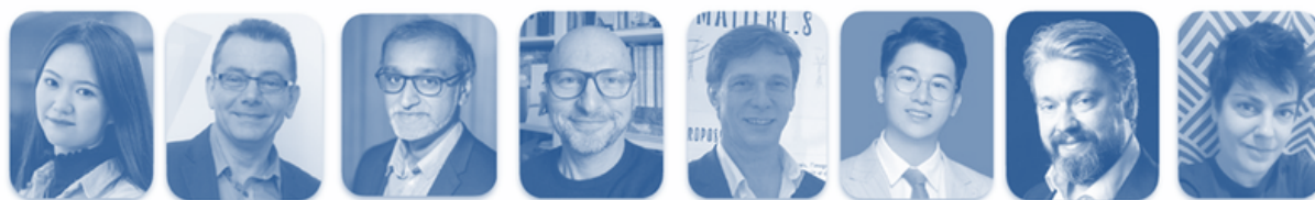
Equipe constituée pour le concours design RTE