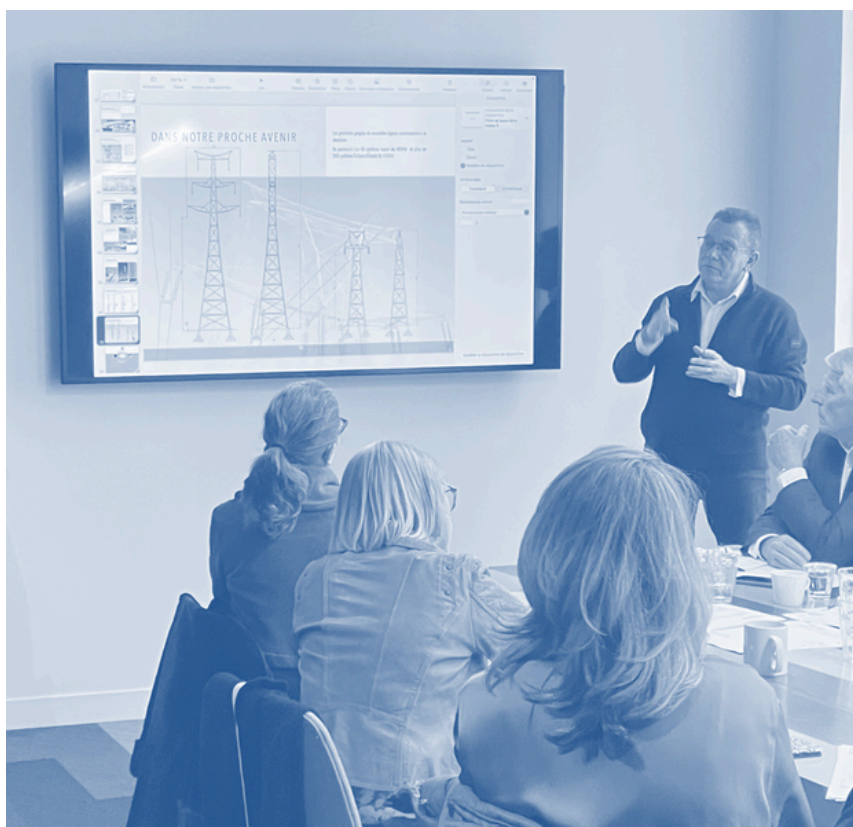
Présentation de la gamme des pylônes au jury du JANUS 2026.