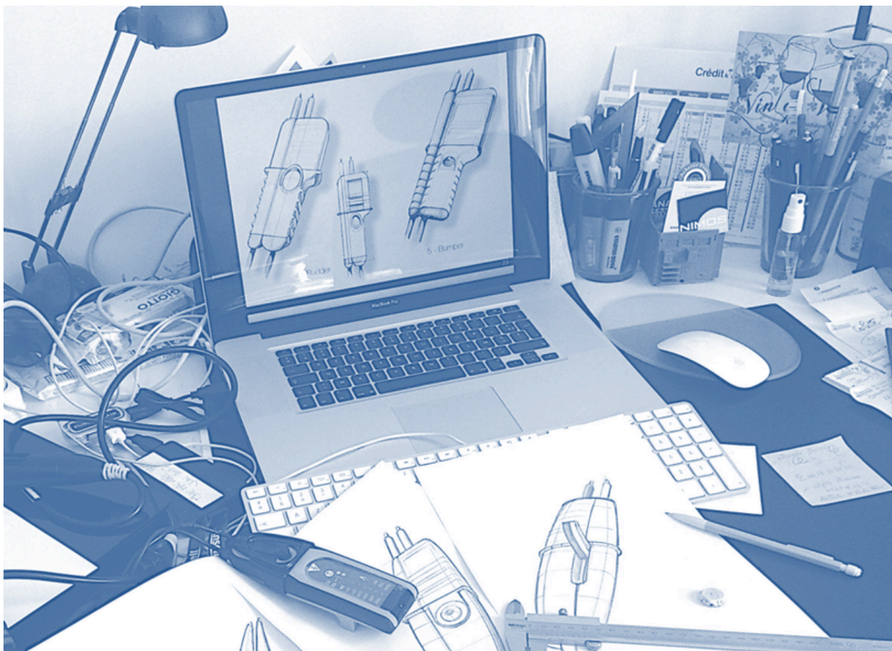
Le bureau d'un designer en phase de créa...